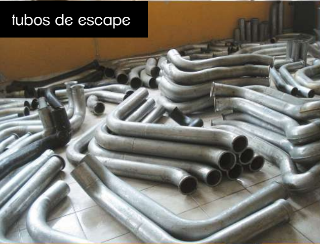
tubos de escape