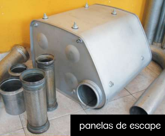
paneles de escape